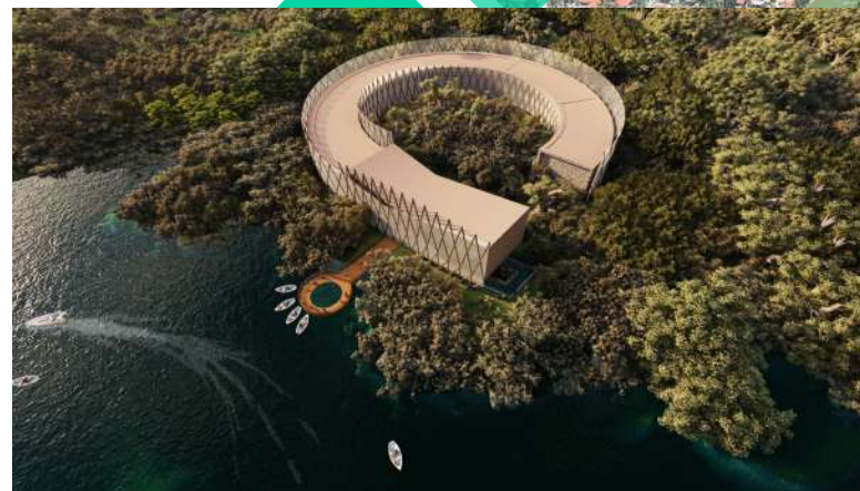
Parque Museo de la Biodiversidad Marítima de Iztapa

Medio ambiente, sostenibilidad y desarrollo de la mano, ofreciendo calidad de vida para todos.