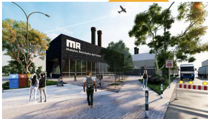
Planta de Reciclaje Regional Integral para el Puerto.