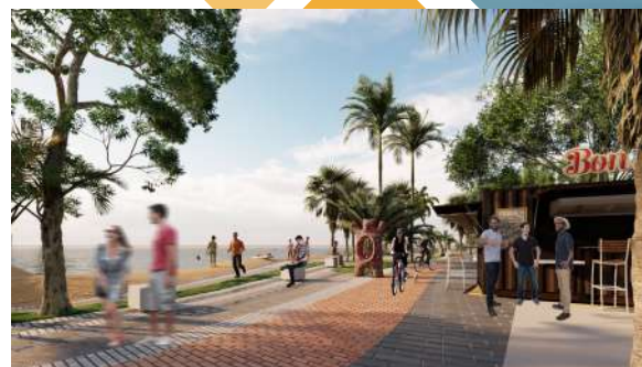
Rambla de San José - Revitalización de la Línea Costera