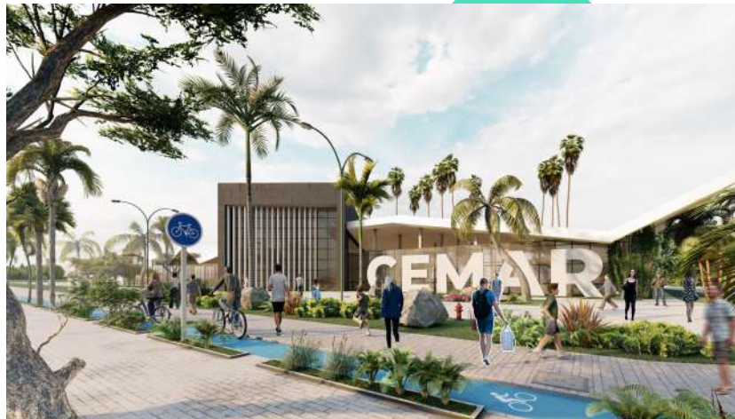
Ciudad de Mariscos, Mercado y Centro de capacitación especializado en mariscos.